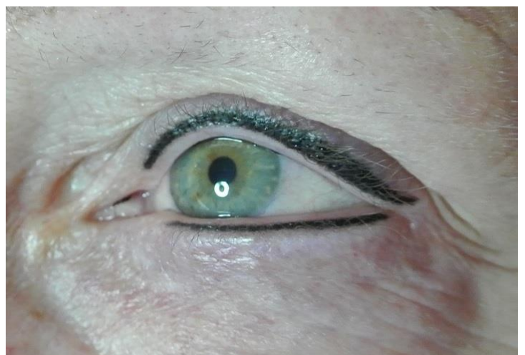
(De ogen zijn meteen sprekender na het aanbrengen van een eyeliner.)