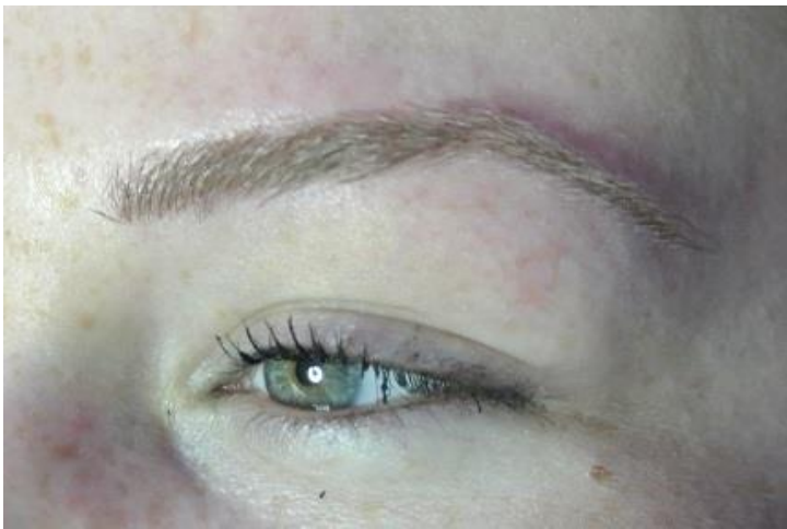
(Eindresultaat bij een blonde klant, ook met lichte kleuren zijn Hairstrokes prachtig.)

Het pigmenteren van wenkbrauwen neemt ongeveer anderhalf uur in beslag, dit is inclusief het voortekenen van de wenkbrauwen en het bepalen van de juiste kleur.