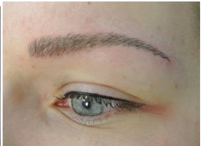
(Eindresultaat hairstroke techniek, niet van echte wenkbrauwen te onderscheiden.)